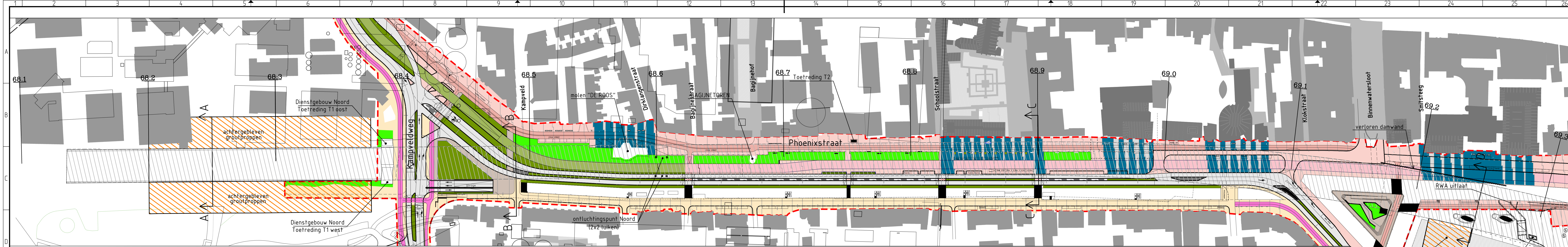
Situatie Km 68.100 - Km 69.300 schaal 1:1000